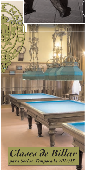
Clases de Billar para Socios. Temporada 2012/13

Swing, boleros, merengue, bachata y chachachá fueron algunos de los bailes que los alumnos casinistas aprendieron en las clases, celebradas los lunes, martes y miércoles de cada semana. Además, es pre-